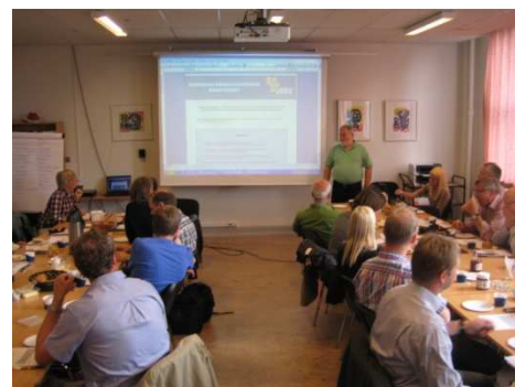
Det blev lyttet på mødet, men der var også en skarp dialog om indholdsdelen i det web baserede program genvej.nu .

UURS – Ungdommens Uddannelsesvejledning Region Sjælland – www.uurs.dk